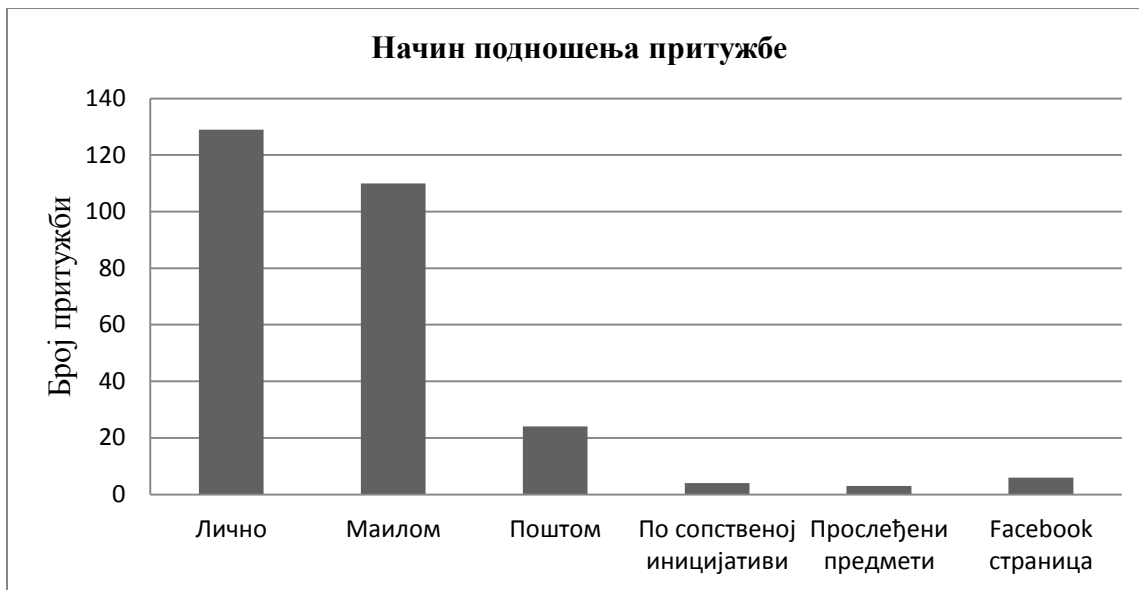
Графикон 1. Начин подношења притужбе Заштитнику грађана

На основу Табеле 2. и Графикана 1. може се уочити да се наставља повећање обраћања грађана Заштитнику грађана Града Новог Сада путем електронских средстава комуникације. Како се повећање ове врсте обраћања грађана посебно истакло током протекле године, крајем 2015. године је омогућено грађанима да притужбе подносе и on-line, путем интернет презентације Заштитника грађана Града Новог Сада. На сајту се налази детаљно образложење о надлежностима Заштитника грађана Града Новог Сада, потом упутство о попуњавању притужбе која се подноси Заштитнику грађана, као и формулар притужбе који је потребно да грађани попуне. Формулар, као и цела интернет презентација, преведени су и на језике националних мањина, мађарски, русински и словачки, те припадници наведених националних мањина имају могућност да се Заштитнику грађана Града Новог Сада обратe и на свом матерњем језику. У 2015. години није било притужби поднетих на овај начин, с обзиром да је интернет презентација почела са радом пред сам крај године.