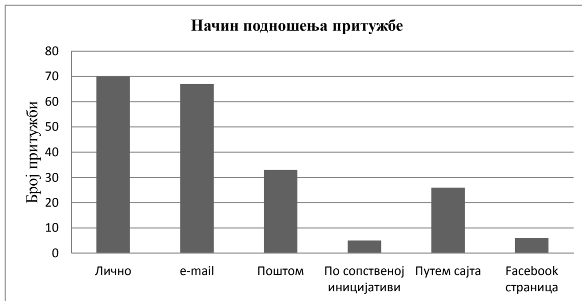
Графикон 1. Начин подношења притужбе Заштитнику грађана

На основу података из Табеле 2. и Графикона 1. може се уочити да грађани и даље најчешће лично подносе притужбе, али да је настављено повећање обраћања грађана Заштитнику грађана Града Новог Сада путем електронских средстава комуникације. Крајем 2015. године је омогућено грађанима да притужбе подносе и online, путем интернет презентације Заштитника грађана Града Новог Сада, тако да је током 2016. године забележено 26 обраћања путем сајта. На самом сајту се налази детаљно образложење о надлежностима Заштитника грађана Града Новог Сада, потом упутство о попуњавању притужбе која се подноси Заштитнику грађана, као и формулар притужбе који је потребно да грађани попуне. Формулар, као и цела интернет презентација, преведени су и на језике националних мањина, мађарски, русински и словачки, те припадници наведених националних мањина имају могућност да се Заштитнику грађана Града Новог Сада обрете и на свом матерњем језику. Такође, Заштитнику грађана Града Новог Сада се путем Facebook странице обратило 6 грађана.