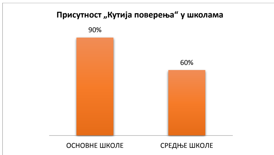
Графикон 2. Присутност „Кутија поверења“ у школама

Детаљан приказ може се видети на графикону 2.