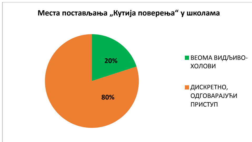
Графикон 3. Приказ у процентима постављених „Кутија поверења“ на упадљивој/неупадљивој локцији у школи

Када је у питању место где је постављена „Кутија поверења“, примећено је неколико верзија. У већини школа кутије су постављене на позиције које су у складу са анонимним пријавама. То заправо указује да су управо на местима која „не упадају у очи“ (нису изложене јавно, у холовима), што свакако доприноси лакшој пријави; ученици који трпе насиље могу да избегну погледе и сусрете са ученицима који врше насиље над истим, и да неприметно убаце информацију у кутију. Сматрамо ово од изузетне важности, јер управо страх од ученика који врши насиље блокира ученика који трпи насиље да га пријави како не би и због пријаве доживео још виши облик насиља. У наведеном графикону 3. приказани су подаци о местима постављених „Кутија поверења“ у свим школама које их имају.