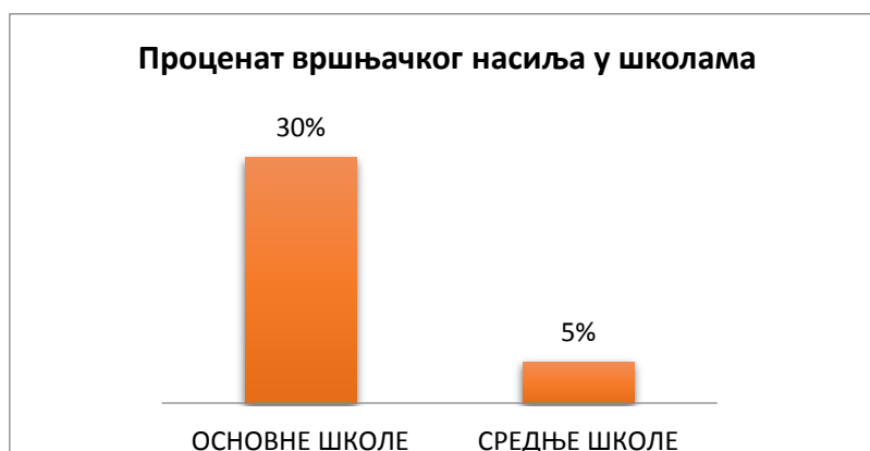
Графикон 5. Процент вршњачког насиља у школама

У појединим школама насиље, то јест пријава вршњачког насиља уопште нема, док је у неким и прилично високом проценту у односу на претходне године. Као што је напоменуто, узроци су различити. Велики утицај на то има број ђака у школи; у школама где је велики број ученика су и веће шансе за сукоб међу ученицима који може да ескалира у вршњачко насиље. Такође утицај на проценат насиља у школама има и фактор социјалне средине. Затим, као што је већ напоменуто и социјално/емотивна зрелост ученика има улогу у томе; у основним школама ученици су мање свесни последица које могу бити и трајне како по себе тако и по околину и окружење у којем живе управо због тога. Сам проценат вршњачког насиља креће се од 0 па чак и до 30%. У наведеном графикону 5. приказан је проценат насиља у свим основним и средњим приватним и државним школама.